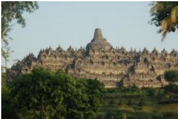
Borobudur East Gate