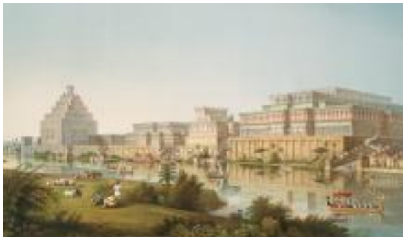
Recostruzione di Nimrud, la capitale assira. Kishu, nord, Minori d'Arqueologia in L'Espresso 1993, p. 9.

Sede: Centro Pime - Sala Beato Mazzucconi, Via Mosè Bianchi 94, Milano