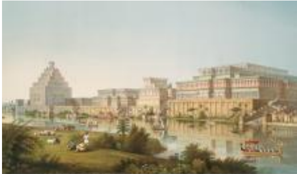
Recostruzione di Ninive, capitale assira (Kishu, nord, Ninive) (Fagnano in Leyser 1883, pl. 1)

Sede: Centro Pime - Sala Beato Mazzucconi, Via Mosè Bianchi 94, Milano