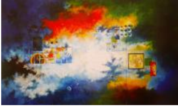
Manish Lal Shrestha - Sound of the Universe

Sede: Spazio Mantegna - via Piero della Francesca 4/7 ang. via Mantegna 5, Milano